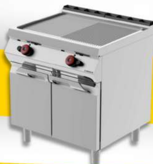
PLAQUE GRILLADE PLANCHES À FRIRE À GAZ ET ELECTRIQUE