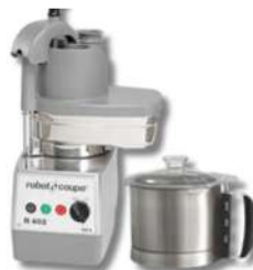
COMBINÉS CUTTER ET COUPE LÉGUMES