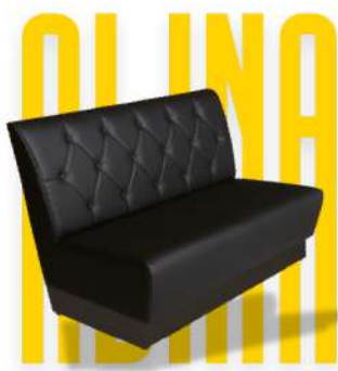
BANQUETTE - ALINA

FABRIQUER AVEC FIERTÉ AU MAROC OUR STRAIGHTS.