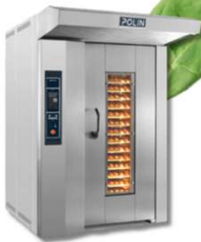
POLIN FOUR À BOULANGERIE