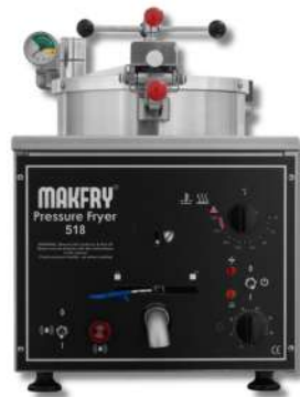
FRITEUSE À PRESSION 518