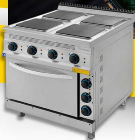
CUISINIERE 4 PLAQUES / FOUR