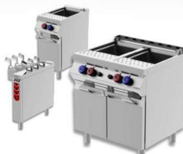
CUISEUR À PÂTES GAZ / ELECTRIQUE SIMPLE / DOUBLE