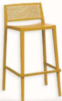
GRID - LOW