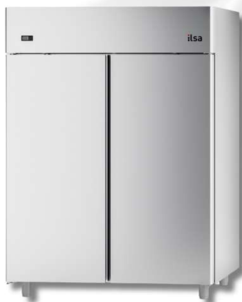
ARMOIRE RÉFRIGÉRÉE - POSITIVE (DIVERS DIMENSIONS)