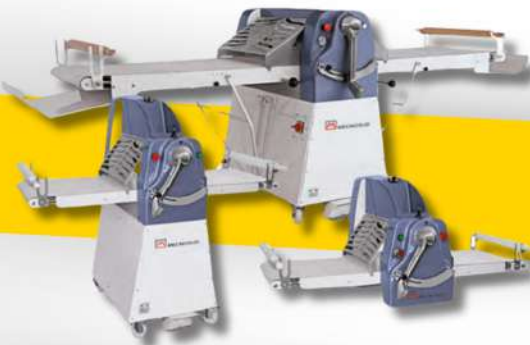
MICROSID BATEUR MELANGEUR