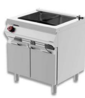
BAIN MARIE SIMPLE / DOUBLE