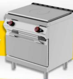
PLAQUE COUP- DE FEU PLAQUE DOUBLE A GAZ AVEC FOUR