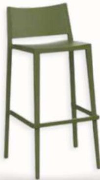
MOSK - HIGH