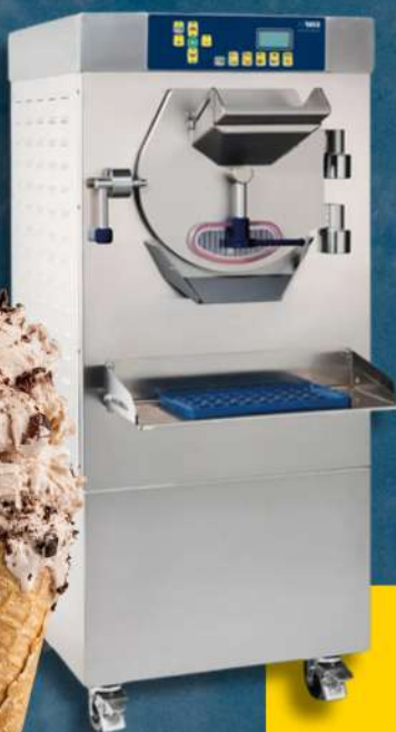
SMARTGEL congélateurs horizontaux par lots