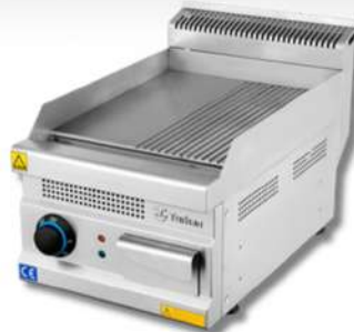
BARBECUE À POSER