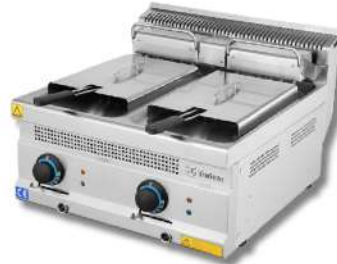
FRITEUSE SIMPLE/ DOUBLE