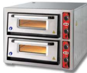
GMC FOUR À PIZZA ÉLECTRIQUE 1/2 ETAGES