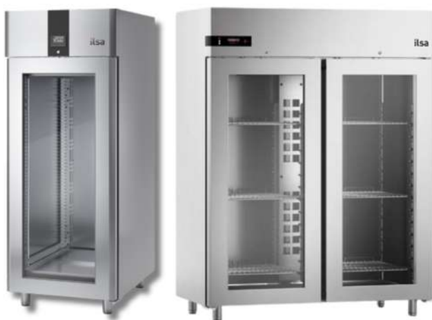
ARMOIRE DE MATURATION