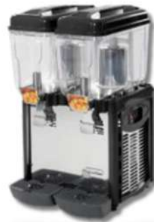
DISTRIBUTEUR À JUS