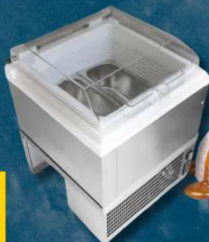
VISAGEL VITRINES À GLACE