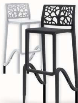
TABOURET ZEFIRO 750