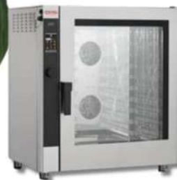
TECN&DOM FOUR GAS - ÉLECTRIQUE