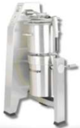
CUTTER ROBOT COUPE R30