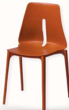
CHAISE - OBLONG