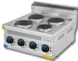
RECHAUD 4 PLAQUES