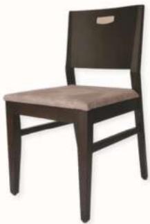
CHAISE - CHI008