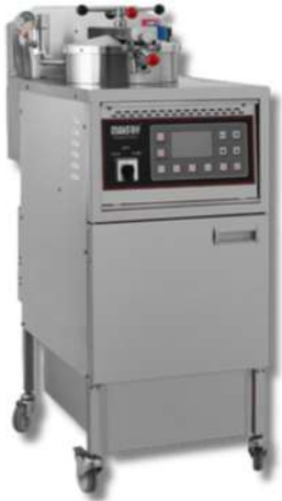
FRITEUSE À PRESSION 1015 PD