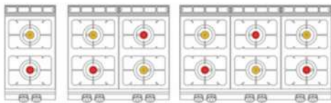
CUISINIERE 2/4/6/8 SUR SUPPORT/FOUR