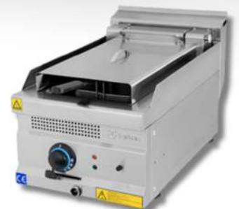
FRITEUSE ELECTRIQUE 2 BACS