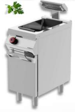
RÉSERVE FRITES SIMPLE / DOUBLE