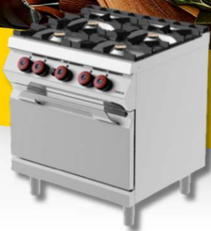
CUISINIÈRE 2/4/6/8 FEUX A/S FOUR