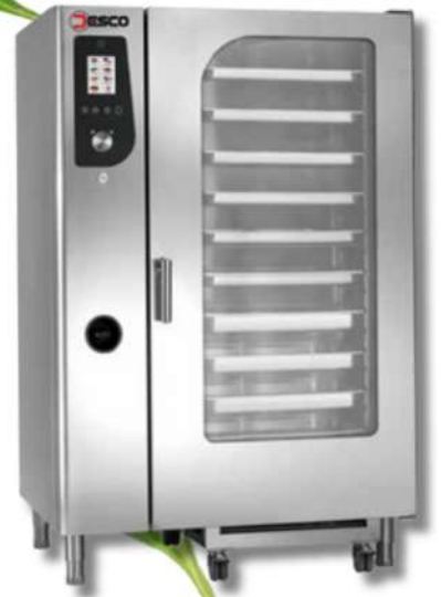
ESCO FOUR À BOULANGERIE ROTATIF