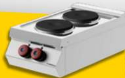
CUISINIÈRE ELECTRIQUE 2 FEUX