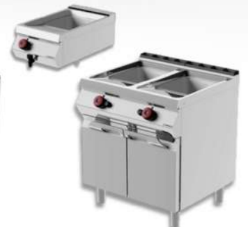
FRITEUSE GAZ / ELECT - SIMPLE / DOUBLE