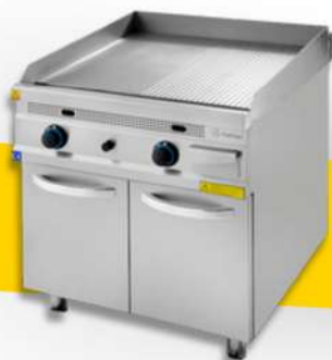
PLAQUE GRILLADE SIMPLE/DOUBLE ELECT/GAZ LISSE/NERVURÉE