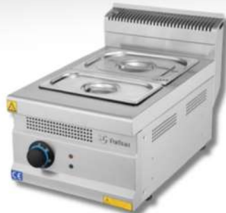
BAIN MARIE ELECTRIQUE À POSER