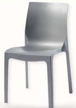
CHAISE - EMMA