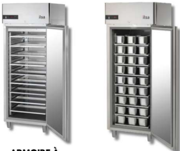
ARMOIRE À PÂTISSERIE 60*80 NÉGATIVE - POSITIVE