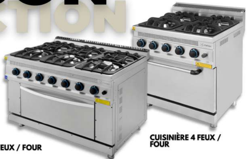
CUISINIERE 6FEUX / FOUR