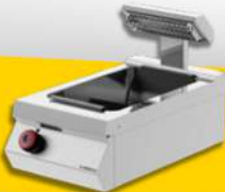
RÉSERVE FRITE SIMPLE