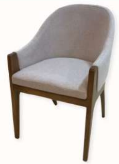
CHAISE - BELLARO VIP