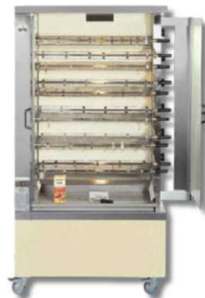
RÔTISSOIRE VERTICALE 2-3-4-8 BROCHES