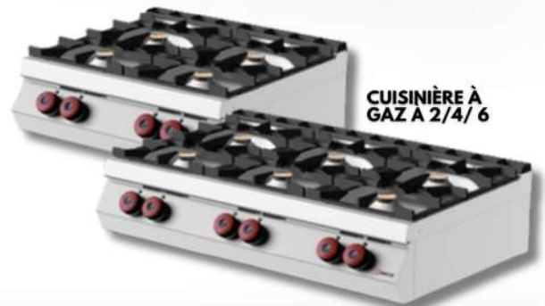
CUISINIÈRE À GAZ A 2/4/ 6