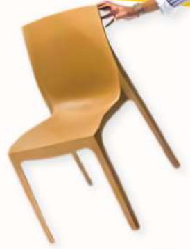
CHAISE - KRAFT