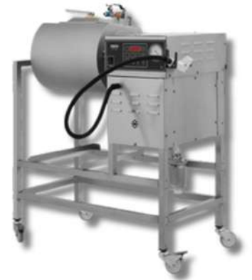
MACHINE À MARINER