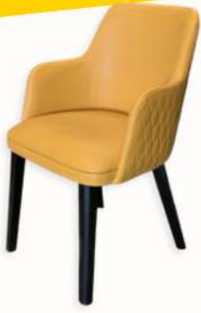
CHAISE - SAN ARM VIP