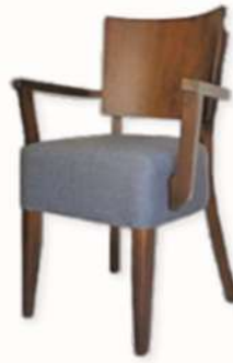
CHAISE - ZARA