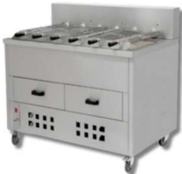
RÔTISSOIRE À CHARBON