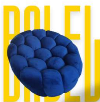
BANQUETTE - BALEL