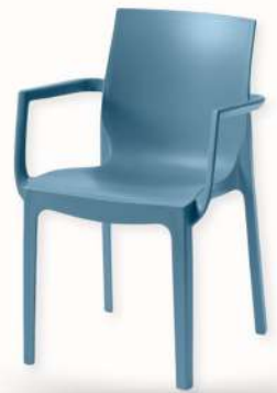
FAUTEUIL - EMMA