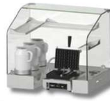
MEUBLE À GAUFRES