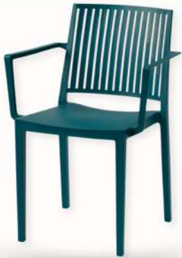
FAUTEUIL - BARS