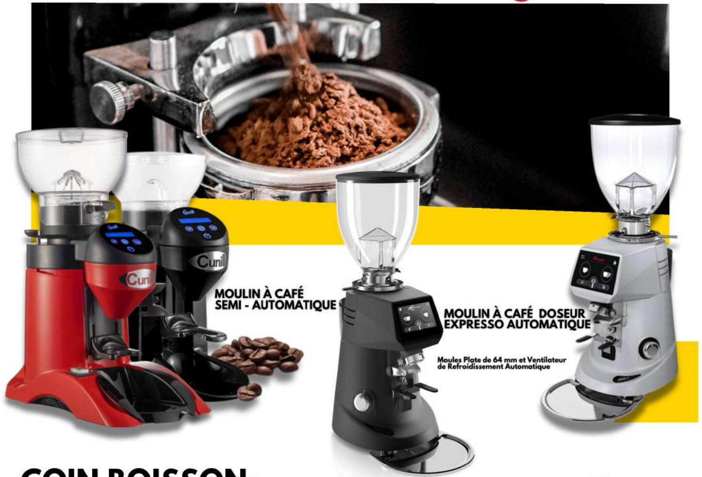
MOULIN À CAFÉ SEMI-AUTOMATIQUE