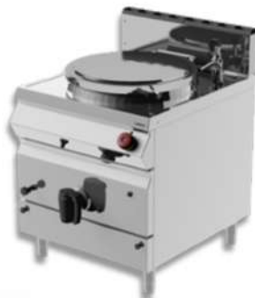
MARMITE À CHAUFFAGE INDIRECT / DIRECT