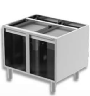
BASE NEUTRE OUVERTE SERIE TOP