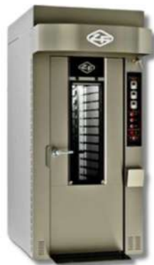
ZUCHELLI FOUR MINI ROTOR GAZ / ÉLECTRIQUE