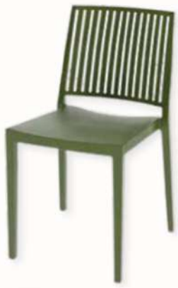
CHAISE - BARS