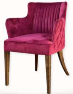
CHAISE AZUR PREMIUM