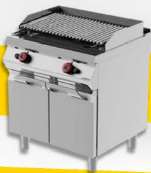
BARBECUE À PIERRES VOLCANIQUES