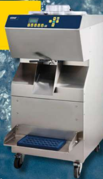
PASTEURISATEUR GROUPE SEMI-HERMÉTIQUE