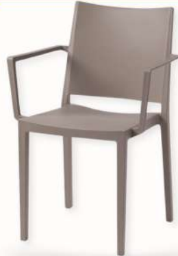
FAUTEUIL - MOSK