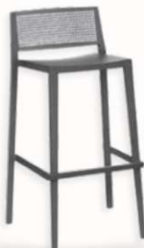
GRID - HIGH