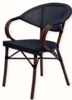
CHAISE - PAUL