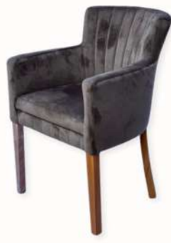
CHAISE - SFAX