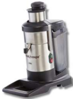
EXTRACTEUR DE JUS