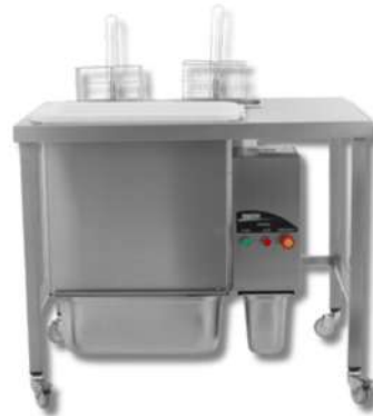
MACHINE A PANER