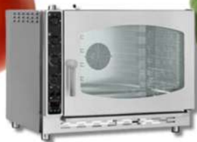
UNO FOUR GAS - ÉLECTRIQUE