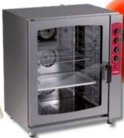
G.PANIZ FOUR À PÂTISSERIE GAZ 10 PLAQUES