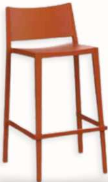
MOSK - LOW