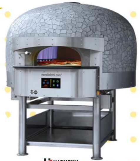
HARMONIA FOUR À PIZZA FEU À BOIS " SUR MESURE "