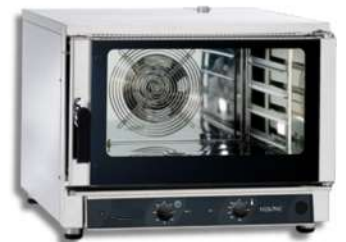
PRIMAX FOUR ÉLECTRONIQUE À CONTROLE DIGITAL NERONE MID