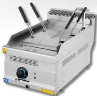
CUISEUR À PÂTES ELECTRIQUE 8 L A POSER