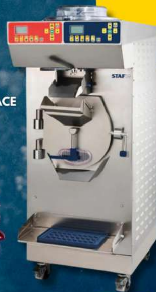
MACHINE À GLACE COMBINÉE