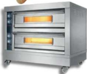
FOUR À PIZZA A GAZ 1/2 ETAGES 2/4/6 PIZZAS