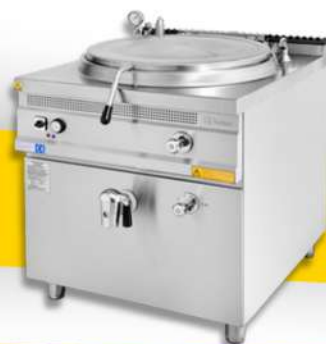
MARMITE CHAUFFE DIRECT