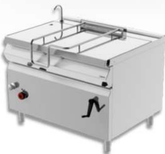
SAUTEUSE BASCULANTE GAZ / ELECTRIQUE