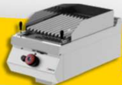
GRILLE À PIERRE DE LAVE SÉRIE TOP