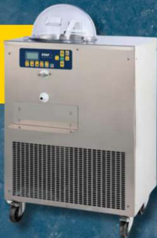
GLS BARATTE À BEURRE

LA PERFECTION EN QUELQUES ÉTAPES. UTILISATION SIMPLE ET INTUITIVE. LES SURGÉLATEURS BATCH STAF59 PERMETTENT ÉGALEMENT DE VÉRIFIER LA CONSISTANCE DU PRODUIT.