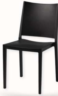
CHAISE - MOSK