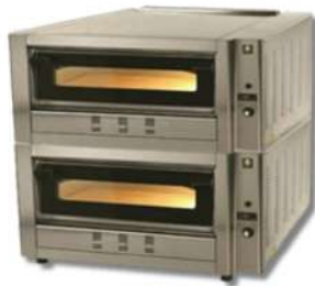
SER GAS FOUR À PIZZA GAZ 1/2 ETAGES