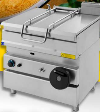
SAUTEUSE BASCULANTE GAZ/ELECT