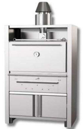
FOUR À BRAISE