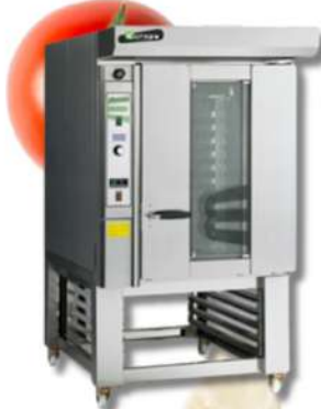
Europa FOUR À BOULANGERIE ROTATIF