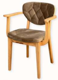
CHAISE - BRESA