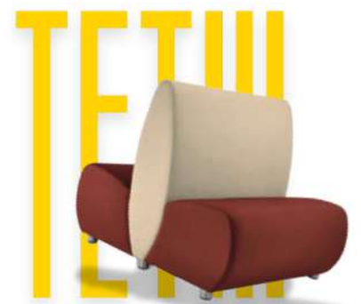
BANQUETTE - TETI