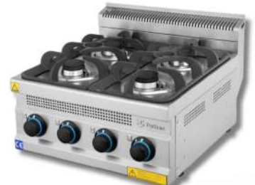
RECHAUD 4 FEUX