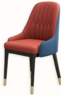
CHAISE - BELLA