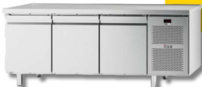
COMPTOIR RÉFRIGÉRÉ 2 / 3 / 4 PORTES